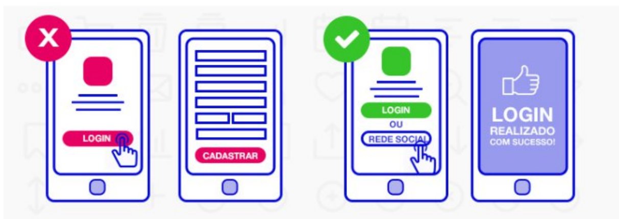
Figura 2 - Aplicando o UX